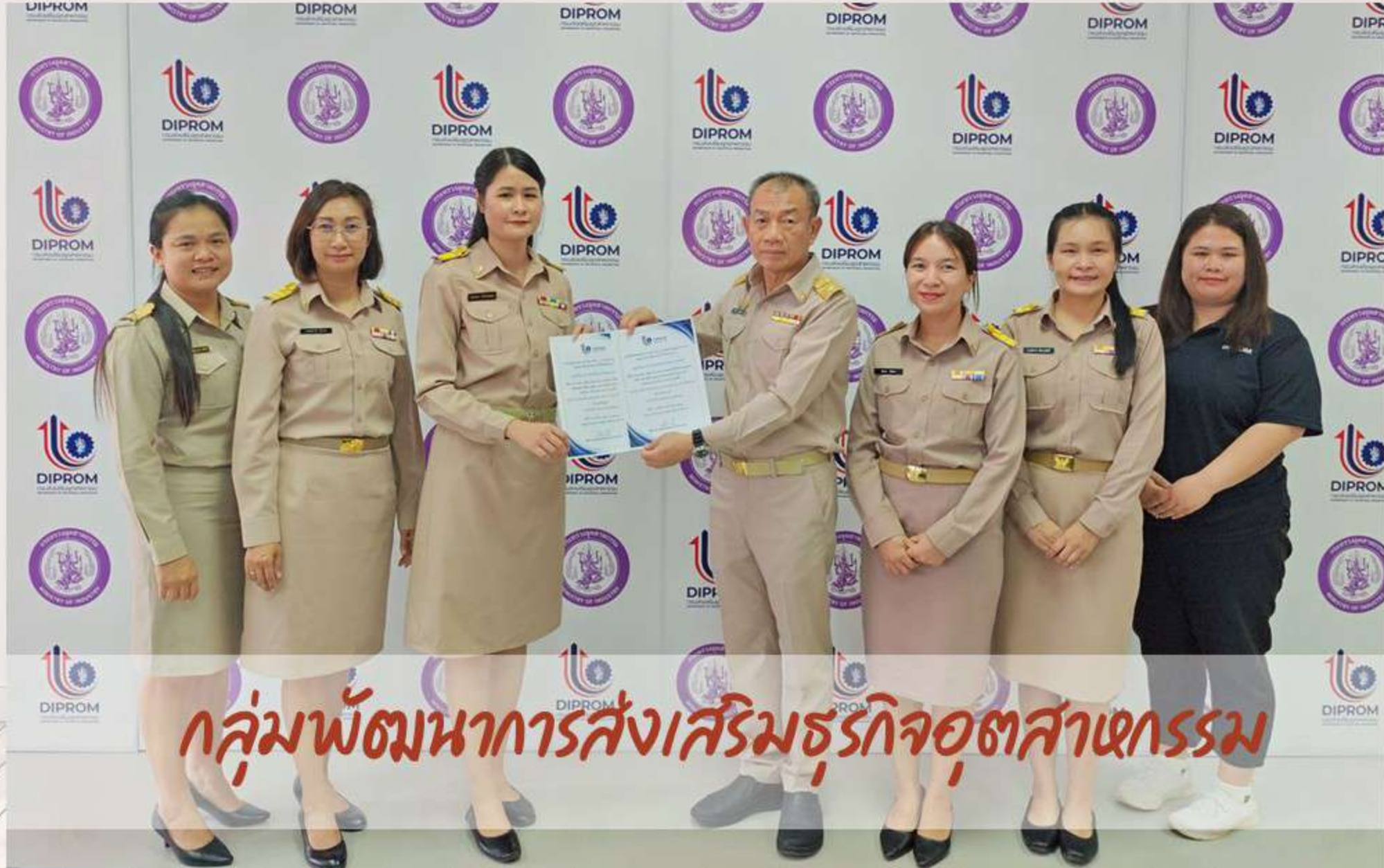
กลุ่มพัฒนาการส่งเสริมธุรกิจอุตสาหกรรม

บุคลากรในหน่วยงาน ร่วมลงคะแนนโหวตในครั้งนี้ จำนวน 42 คน จากบุคลากร ทั้งหมด 48 คน คิดเป็นร้อยละ 87.50